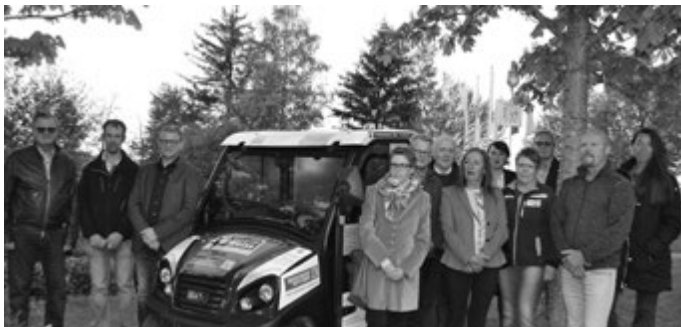
Gruppenbild mit Mule: Dank 27 Sponsoren verfügt der Golfclub seit Neuestem über ein Transportfahrzeug, das rund 700 Kilogramm Last bewegen kann.